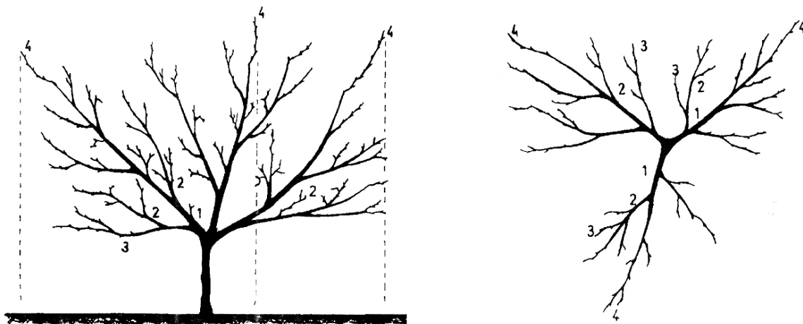
Crtež 9: Oblikovana vaza:

Formiranjem četvrte serije sekundarnih grana završava se formiranje ovog uzgojnog oblika. Nakon toga, vrši se normalna rezidba na održavanje postojeće uzgojne forme voćke i rezidba na rod.